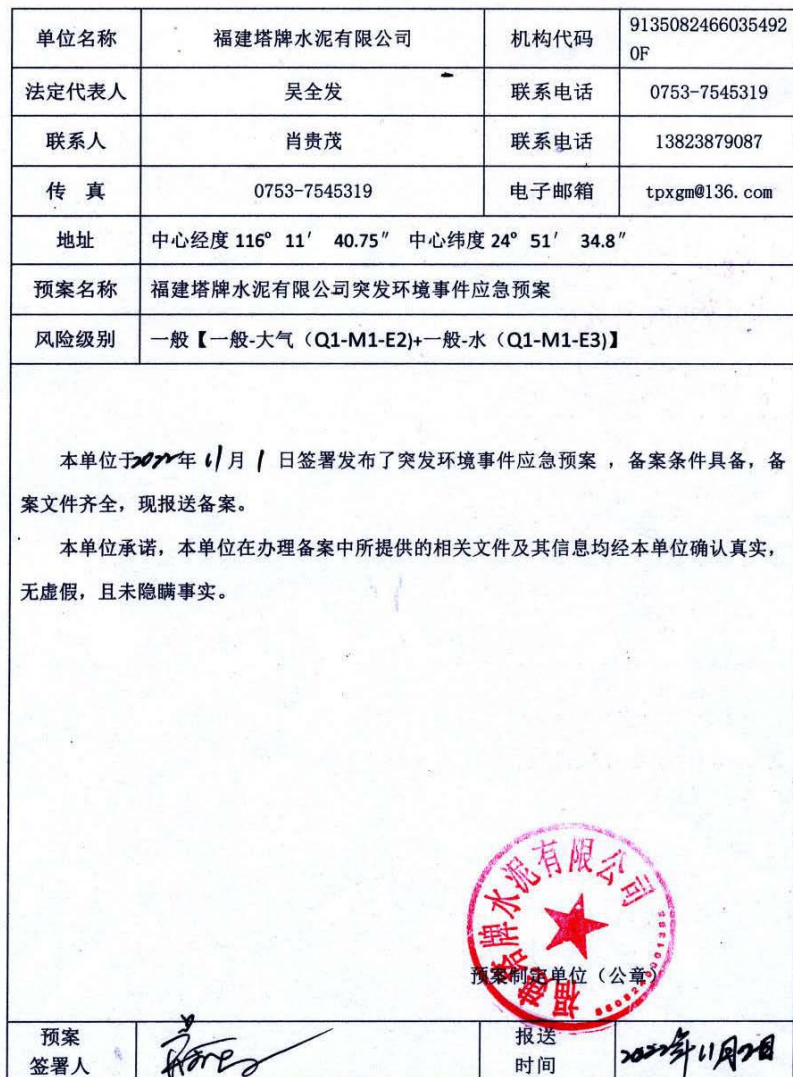
企业事业单位突发环境事件应急预案备案表