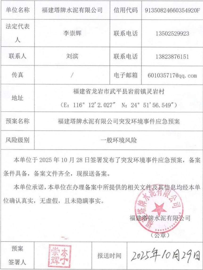
突发环境事件应急预案备案表